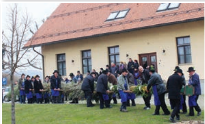
Izdelava presmecev v naselju Radehova in v KS Voličina in postavitve ob lenarško in voličinsko cerkev sta se že zdavnaj zasedrila v tradicijo. Turistično društvo Radehova in Turistično društvo Presmec Dolge Njive sta ji letos dodala novo poglavje. Radehovski presmec je prepeljala kolona koles, 22-metrskega z Dolgih Njiv pa konjska vprega.