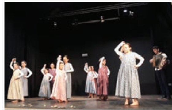
FS OŠ Sveta Ana